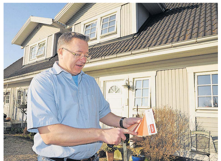
Der Osburger Firmensitz befindet sich in der rechten Hälfte dieses Doppelhauses. Der zarte Farbton des Firmensitzes in Osburg steht für eine von zahllosen Farbvarianten, aus denen Schwedenhaus-Kunden wählen können.