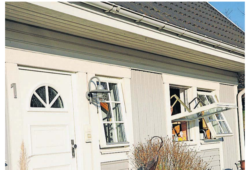
Die Fenster verblüffen mit ihren technischen Feinissen.