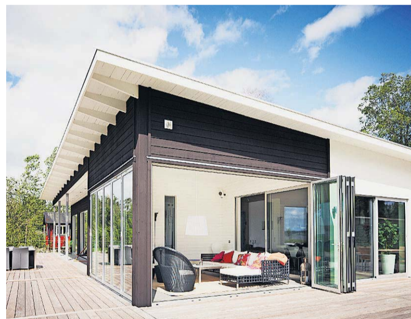
Ein Beispiel für ein Schwedenhaus im modernen Stil.

danken, mit der Bauherren Fenster und Türen einplanen können. Die an Fachwerkhäuser erinnernde Holzbauweise räumt vielfältige gestalterische Möglichkeiten ein: „Von der Statik her ist da vieles machbar.“ Breit gefächert seien zudem die farblichen Gestaltungsmöglichkeiten der witterungsbeständigen und wasserlöslichen Dickschicht Lasuren: „Die Farben halten zehn bis zwölf Jahre.“