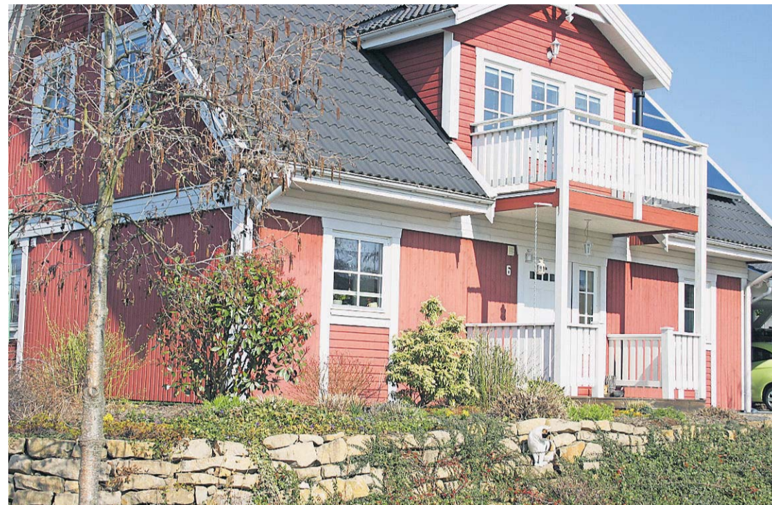
In Osburg gibt es etliche Schwedenhäuser zu entdecken.